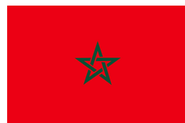
Drapeau du Maroc