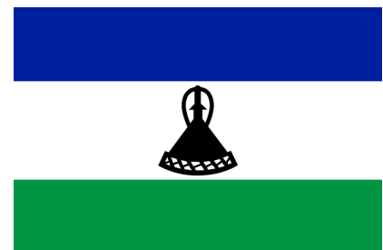
Drapeau du Lesotho

Les pouvoirs des rois du Lesotho et du Maroc sont donc restreints.